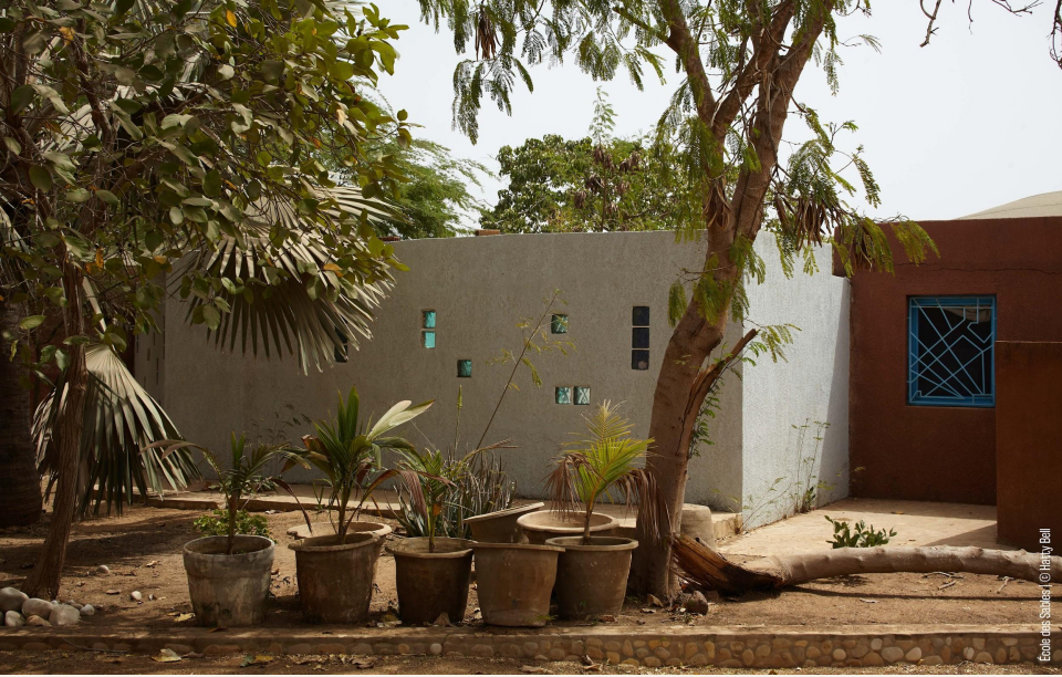
Exterior view of the building