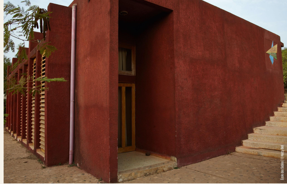
Exterior view of the building